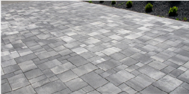
Vitale Farbe: trend (weiß/anthrazit)

Immer wieder schön anzuschauen! Eine perfekte Steingeometrie wird kombiniert mit belebenden und doch dezenten Farbschattierungen.