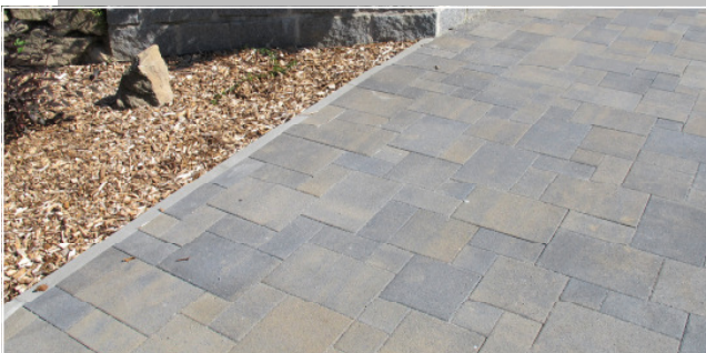
Vitale Farbe: sand-anthrazit nuanciert