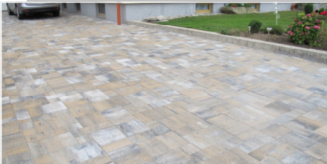
Vitale Farbe: muschelkalk